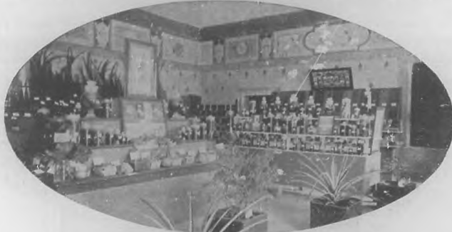
Estación Experimental Agronómica

Secretario de Agricultura, Comercio y Trabajo.