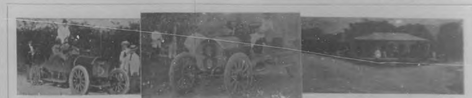
Publicamos unas instantáneas que recuerdan las carreras de automóviles organizadas con gran acierto en los terrenos de "Vista Alegre", de Santiago de Cuba, y que tuvieron efecto el 24 del pasado mes. Su triunfo de unas grandes carreras por la importancia de los premios, fueron interesantes por el plan a que se asociaron apuestas y por la ponida demostrada por los chauffeurs, así como por la bondad de las máquinas.

Donará da esta nota de verdadera actualidad en Provincias.