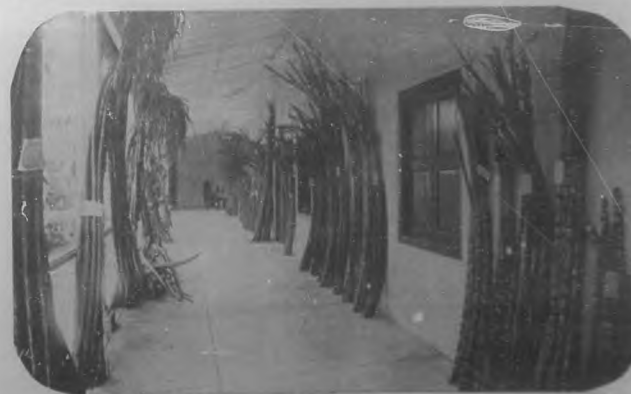
Exhibición de caña de azúcar.