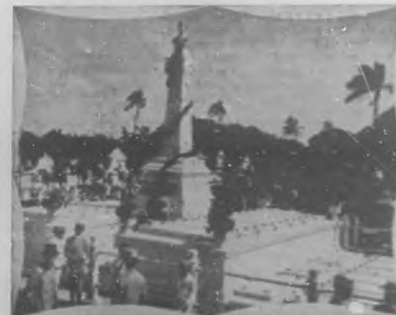
CAMAGUEY.—El pedestal de las referencias donde se colocó el día domingo 24, el busto del Mayor General Ignacio Agramonte.