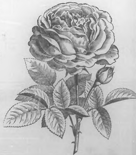
PERLA DE CUBA