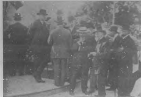
EL 24 DE FEBRERO.—Vista tomada pocos momentos después de terminarse la ceremonia de colocar flores en el pedestal de la estatua del Apóstol José Martí en el Parque Central, donde pueden verse personas concurridas.

Caibarién, en donde "El Liceo" cultísima sociedad cubana, con la cooperación de autoridades, sociedades hermanas y amigos y pueblo, organizó una serie de actos a cual más brillantes en honor del insigne Capablanca.