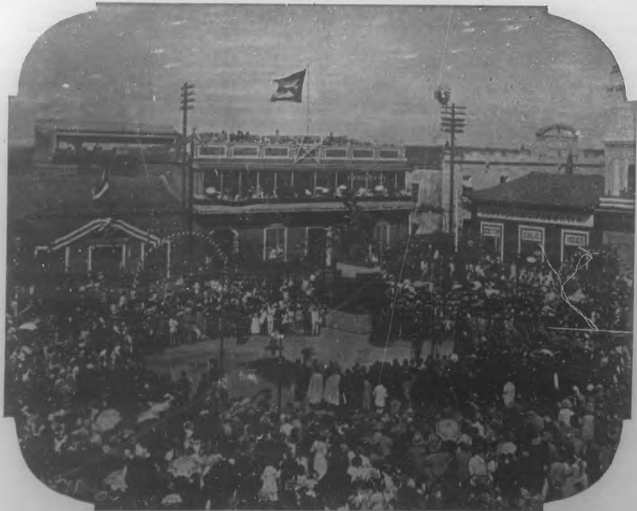
CAMAGUEY.—Inauguración de la estatua ecuestre del Mayor General Ignacio Agramonte, en los momentos de pronunciar el doctor Alfredo Zayas su grandioso discurso.

En la imposibilidad de dar una información completa de la gloriosa excursión, ofrecemos unas fotografías hechas en