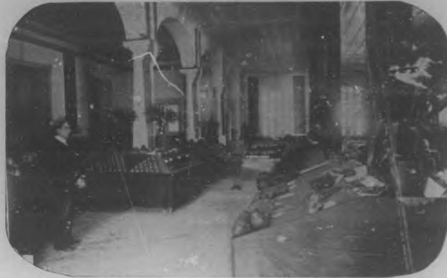
Departamento de Horticultura