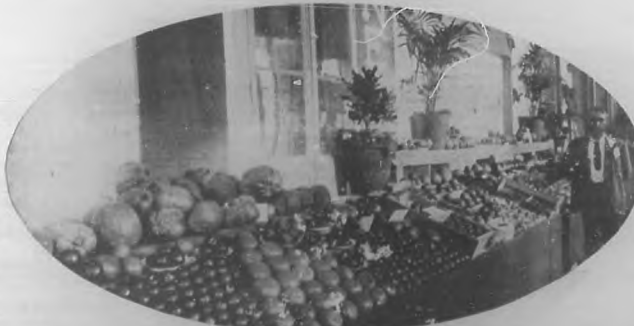
Departamento de Horticultura.