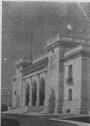
Edificio de la Unión Pan-Americana en Washington.