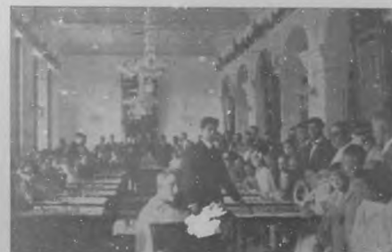
Un aspecto de las partidas simultáneas jugadas en los salones del Liceo de Caibarién por Capablanca.