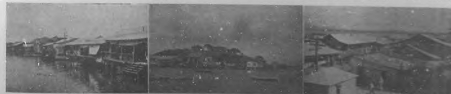
La Calmar era.—Calle principal vista de la bahía.—El Vigía.—Calle principal á real.