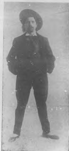
El tenor Battani contratado por la empresa de Payret, próximo a debutar.